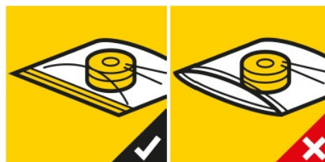
Uzavřete balení co nejtěsněji