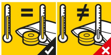
Teploty vzduchu, balené součástky a VCI fólie musí být shodné