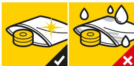
Balte pouze suché a čisté díly